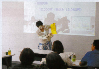
衣類のコンパクトなたたみ方実演