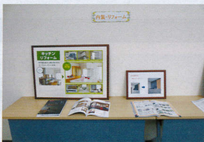
リフォーム事例をわかりやすくパネル展示