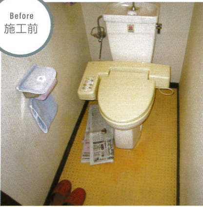
※現場状況により工事価格は変動します。詳しくは担当者までお問い合わせください。