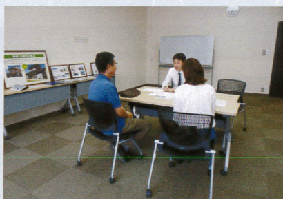
同時開催のリフォーム相談会の様子